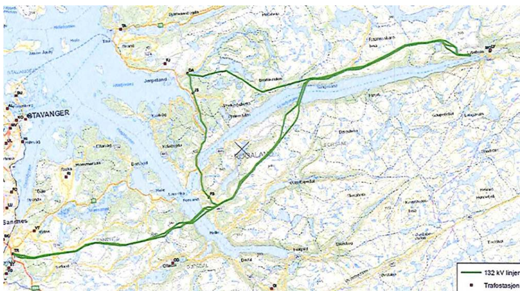
Figur 1: Lyse Elnett sin 132 kV kraftledning mellom Lysebotn og Tronsholen

Islaster for traseen blir oppgitt med 150 års returperiode, og estimeres ut fra nedbørsdata fra værstasjoner i området. Vindlaster oppgis som vindkast med 50 års returperiode og vurderes ut fra Norsk vindstandard (Standard Norge, 2009) sammen med vindmålinger fra stasjoner i området.