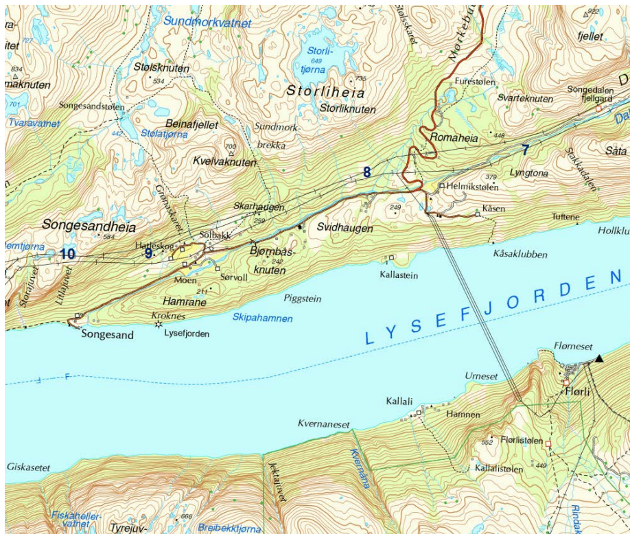
Figur C: Dalardalen til Songesandheia