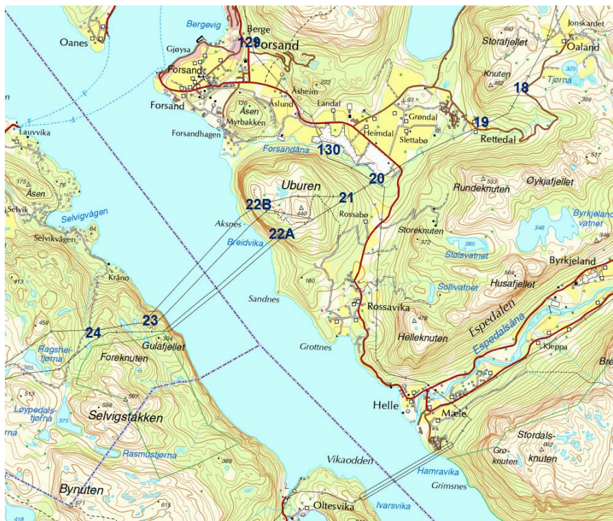
Figur F: Fra Oaland til etter kryssing av Høgsfjorden