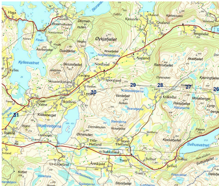
Figur H: Fra Kjerringfjellet til Kråkeberget