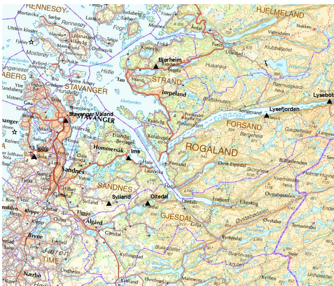
Figur 2: Nedbørstasjoner (svarte triangler) brukt for å estimere islaster fra våt snø.