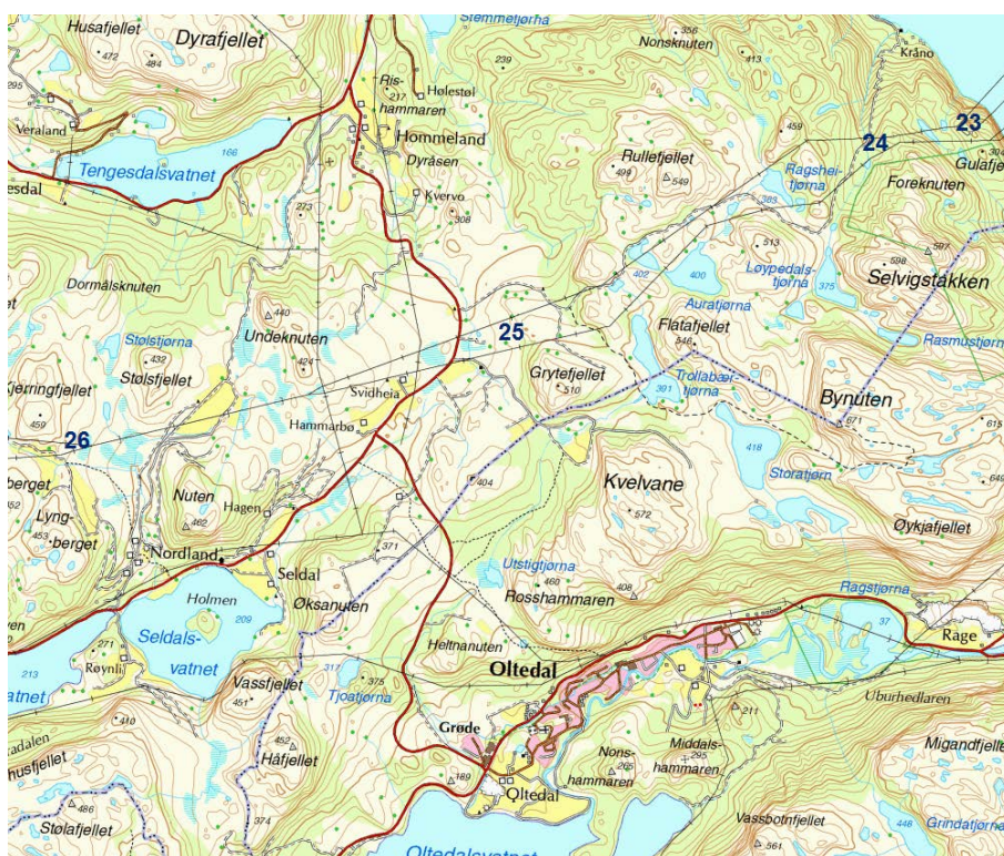
Figur G: Fra Høgsfjorden til Kjerfjell