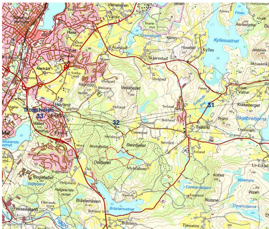
Figur I: Fra Kråkeberget til endepunkt ved Tronsholen