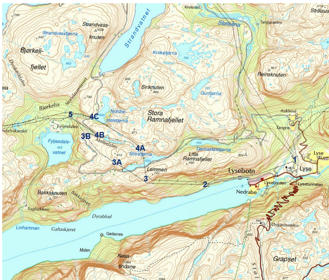
Figur A: Fra Lyse til Fyljesdalsvatnet