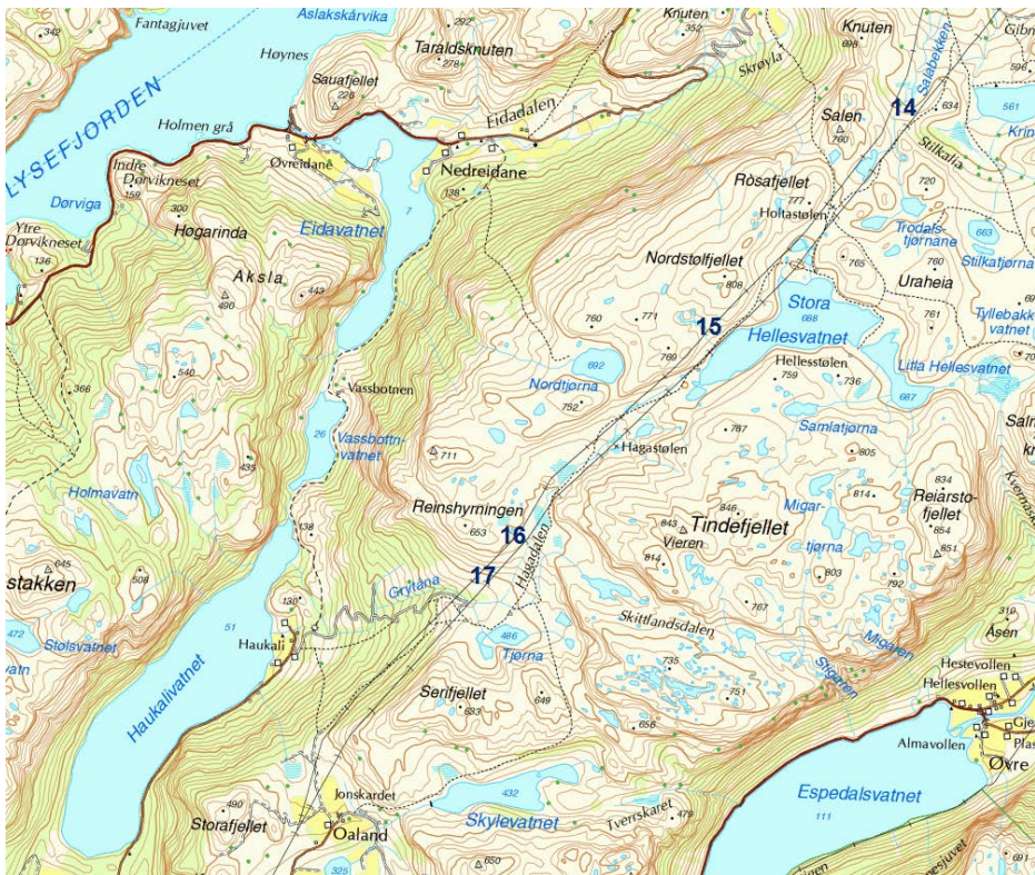
Figur E: Langs Stora Hellesvatnet og videre til Oaland