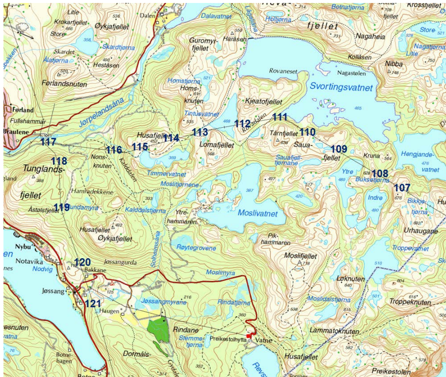
Figur K: Bikkjetjørna til vendepunkt ved Jørpeland og sørover til Botne.