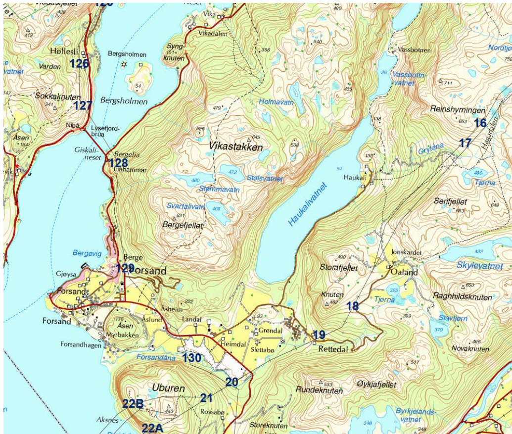
Figur M: Over Lysefjorden, gjennom Forsand og til møte med sørlig trase øst for Uburen