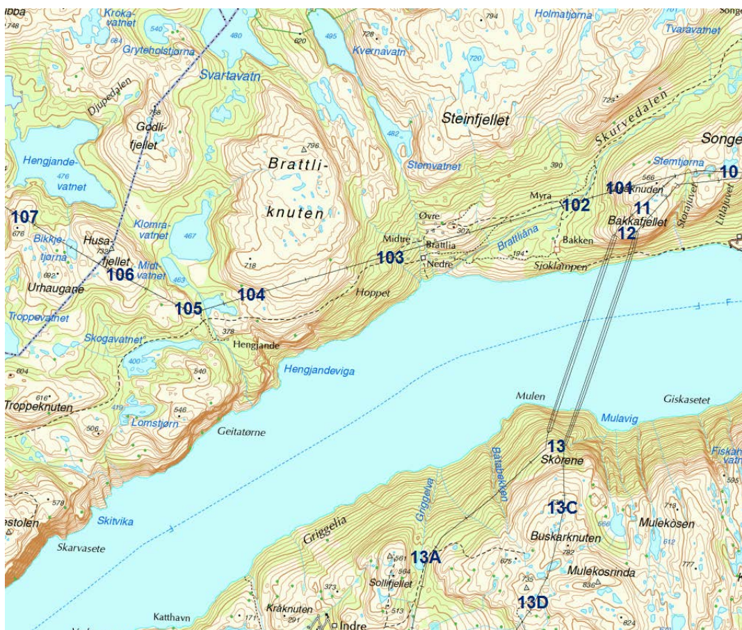
Figur J: Fra startpunkt for nordlig trase til Bikkjetjørna