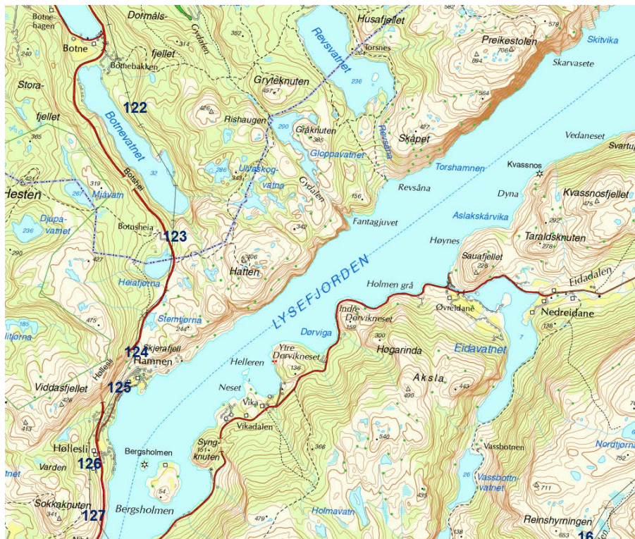
Figur L: Fra Botne til Lysefjorden.