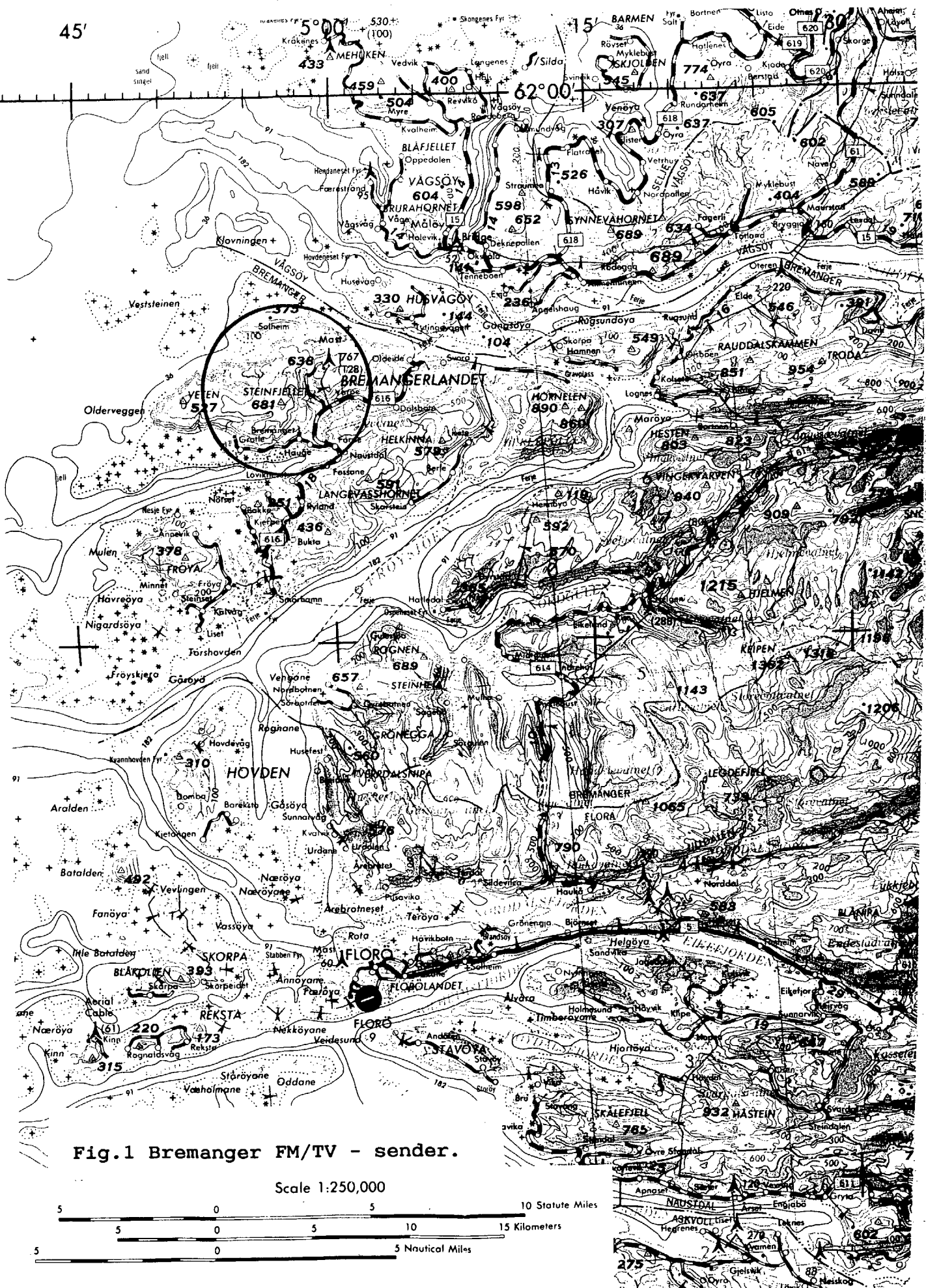
Fig.1 Bremanger FM/TV - sender.